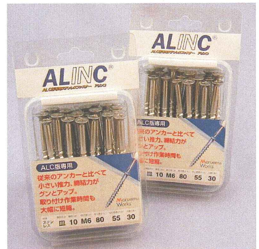
ブリスターパック ブリスターパックは1ケース(パッキン)18個詰